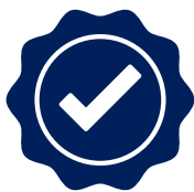
10 års garanti