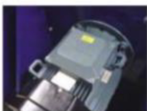
Låg energidåtgång och hög driftsäkerhet med ABB-motorer.