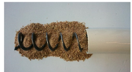
Slitande material, Flex90 stål rör/böj