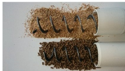
Spannmålskross, Flex90 Pelleterat foder, Flex90/75