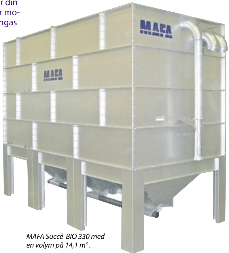
MAFA Succé BIO 330 med en volym på 14,1 m 3 .

MAFA Succé BIO är tillverkad helt i Aluzinkplåt, vilket gör att den passar även för utomhusbruk, den har droppkanter och färre bultar, vilket gör att den är enkel och smidig att montera. Silon finns i fyra längder och fem höjder, vilket svarar mot de flesta behov.